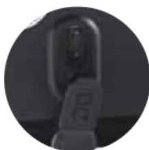
USB charging port