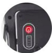
super touch switch LED battery indicator